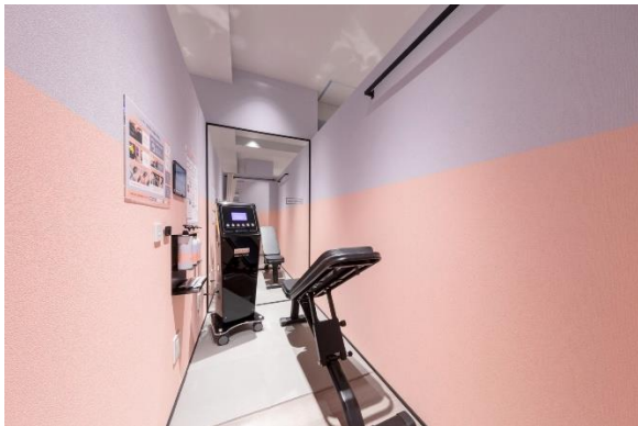
気になるところに好きなだけ、じっくり自分と向き合える完全個室