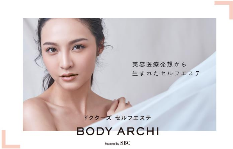
「美容医療発想から生まれたセルフエステ」ドクターズセルフエステ BODY ARCHI (ボディアーキ)